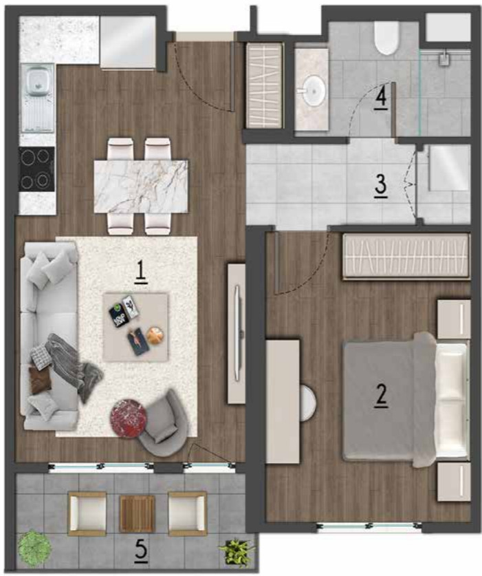
1+1 51 m2