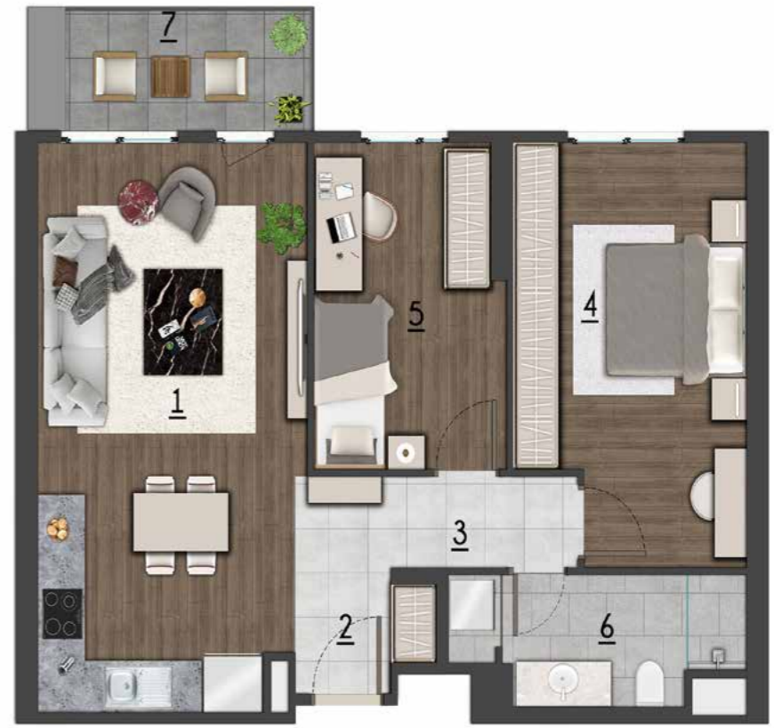
2+1 92 m2