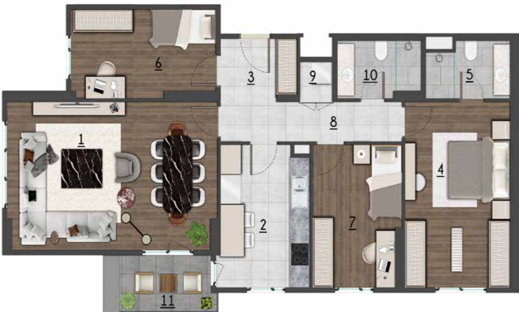
3+1 137 m2