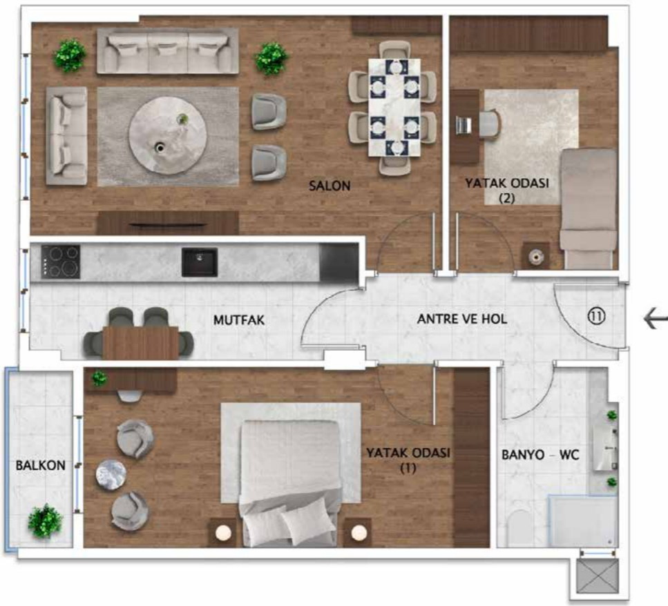
1+1 101 m2