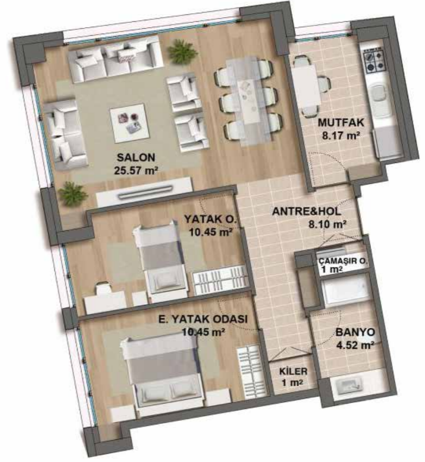
2+1 103 m 2