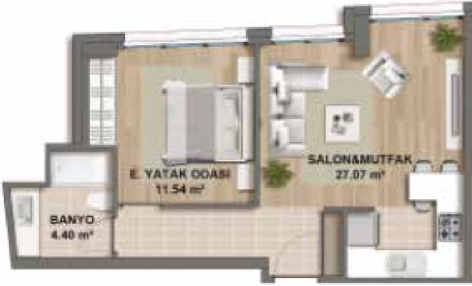
1+1 63 m 2