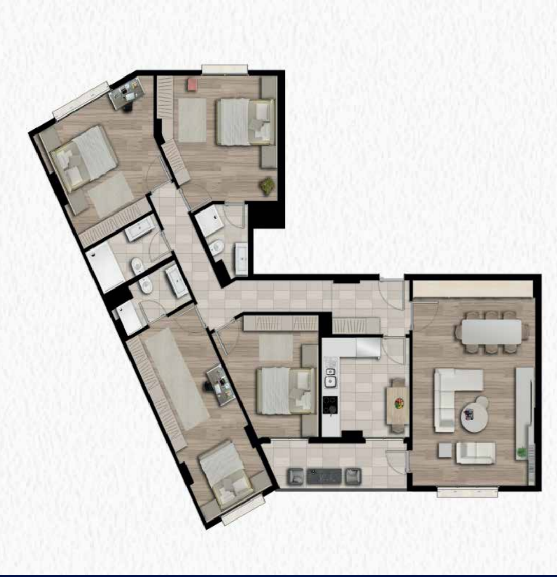
4+1 228 m2