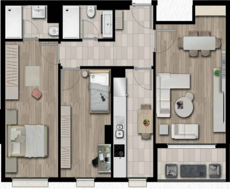
2+1 114 m2