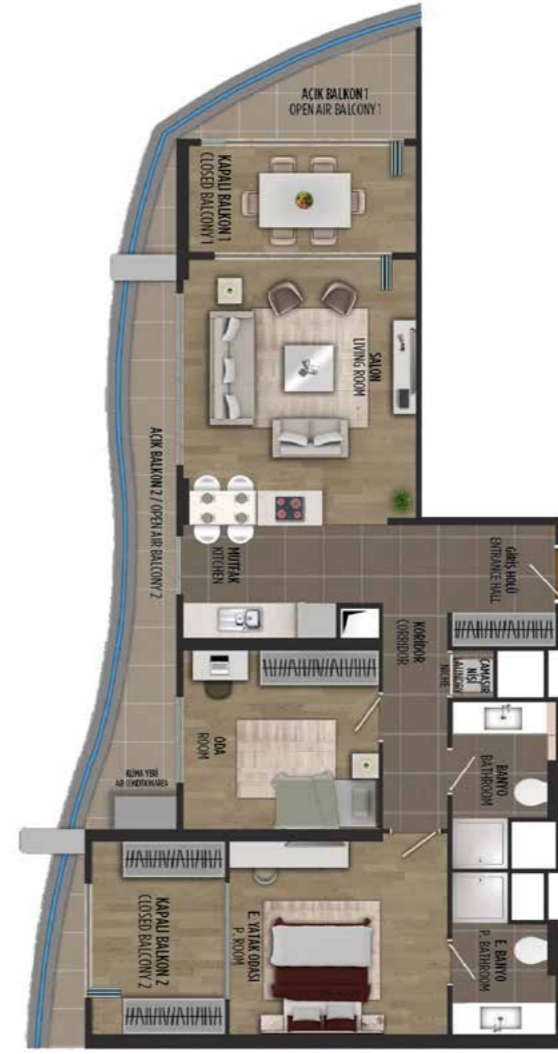
2+1 114 m 2