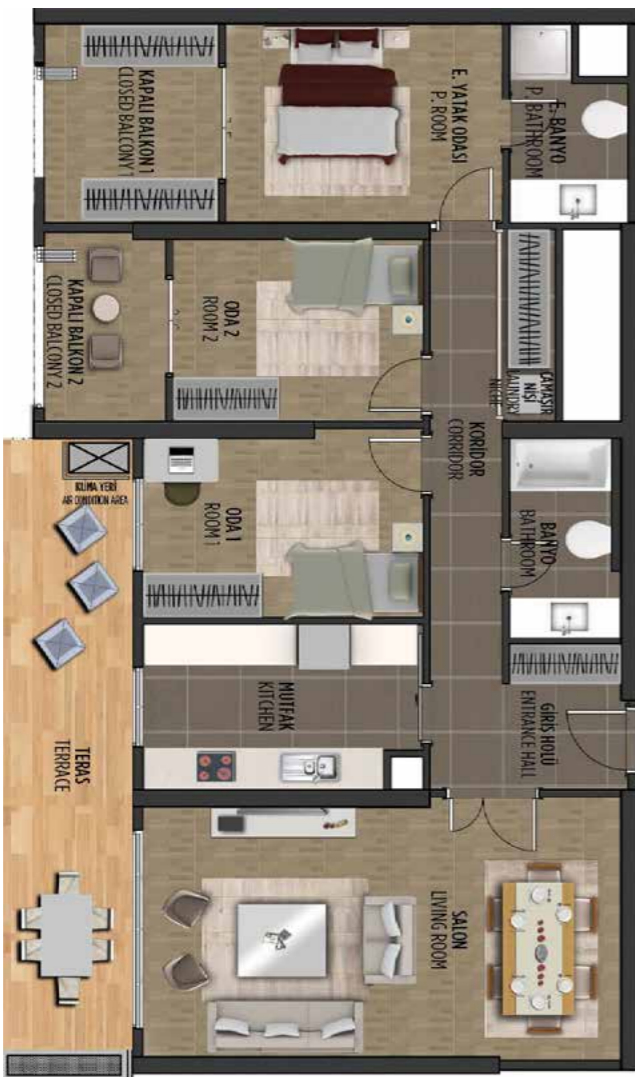
3+1 159 m 2