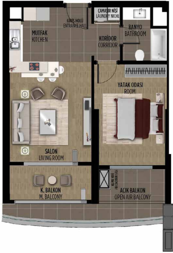
1+1 77 m 2