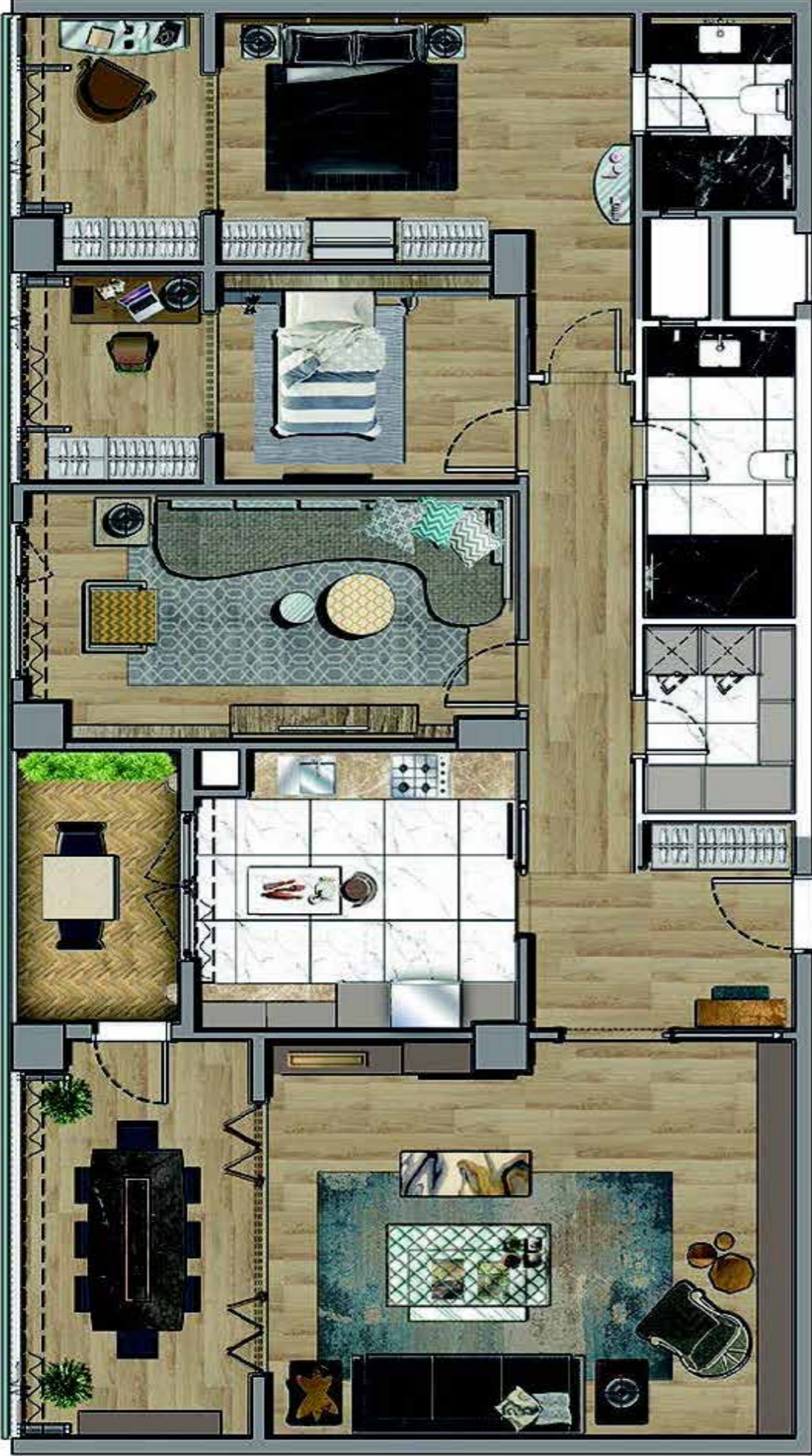
3+1 207 m2