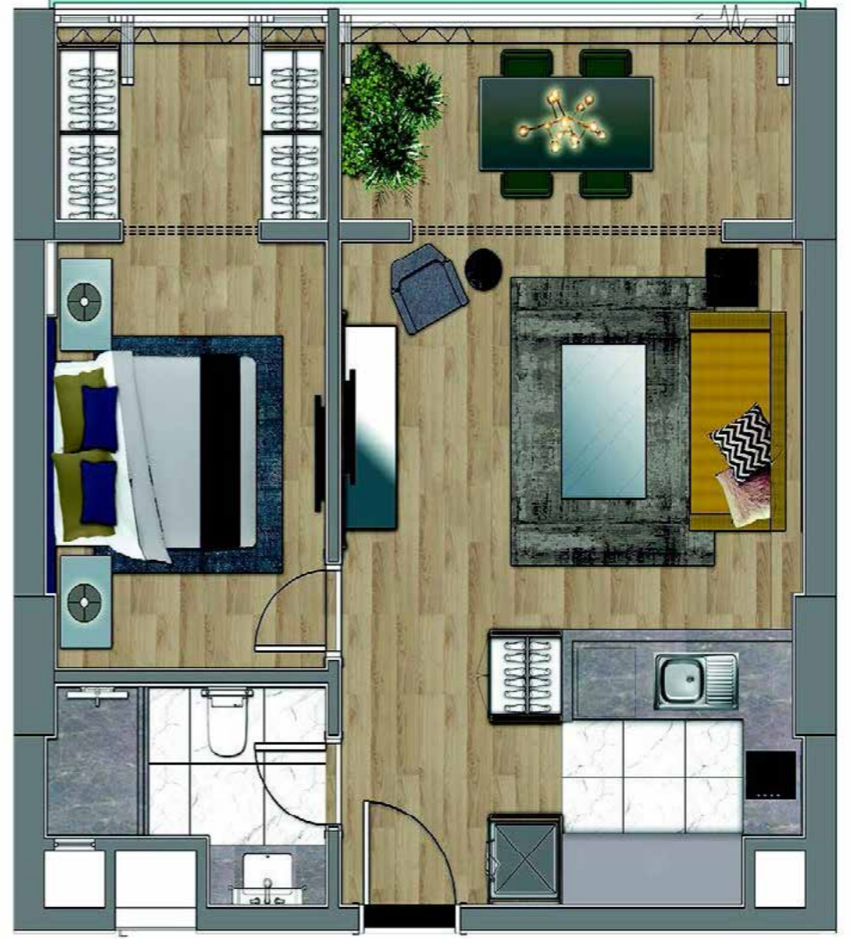
1+1 63 m2