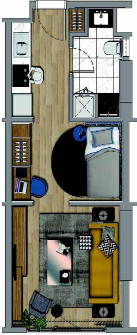
0+1 45 m2