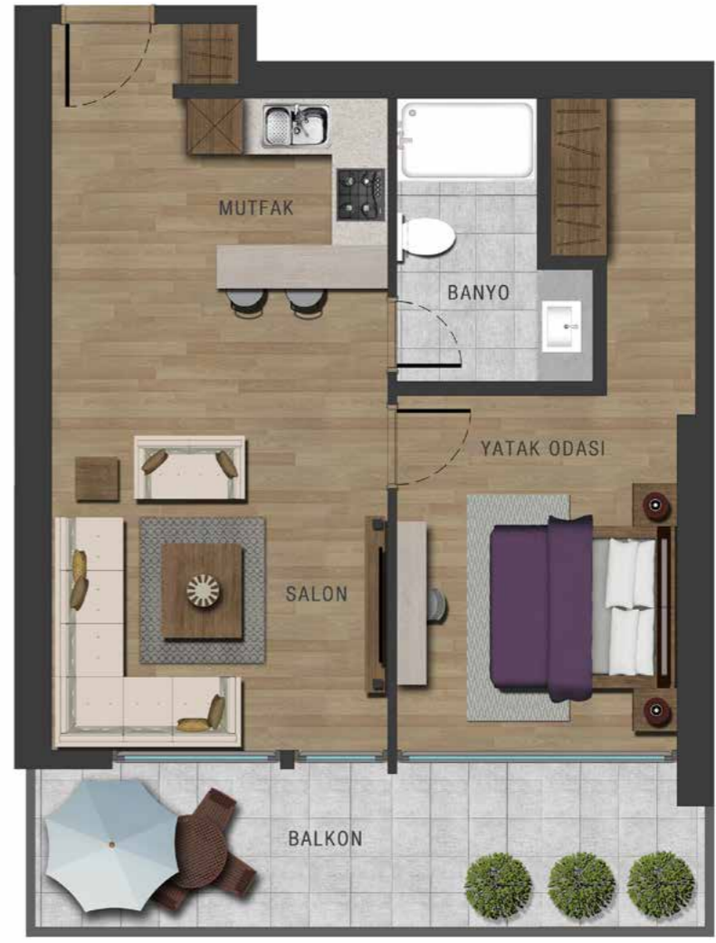
1.5+1 93 m 2