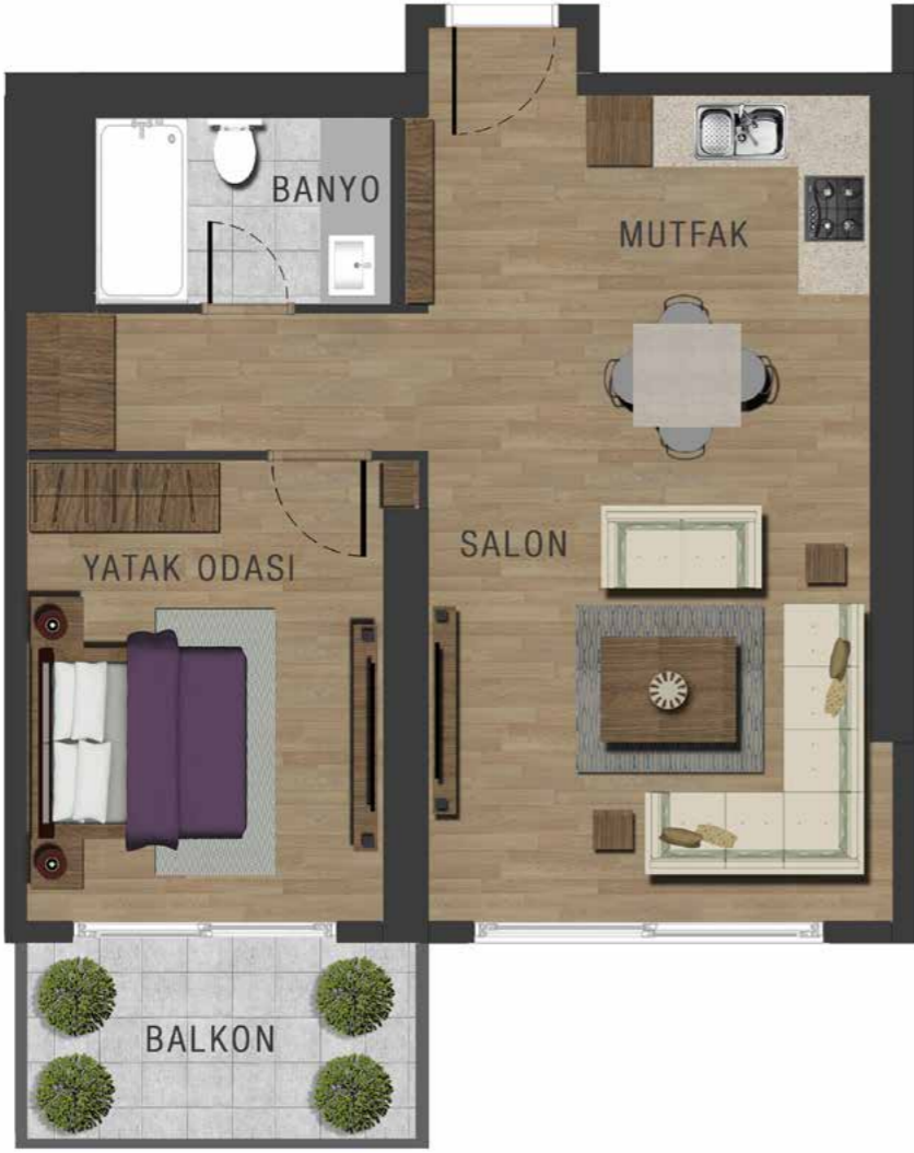
1+1 89 m 2