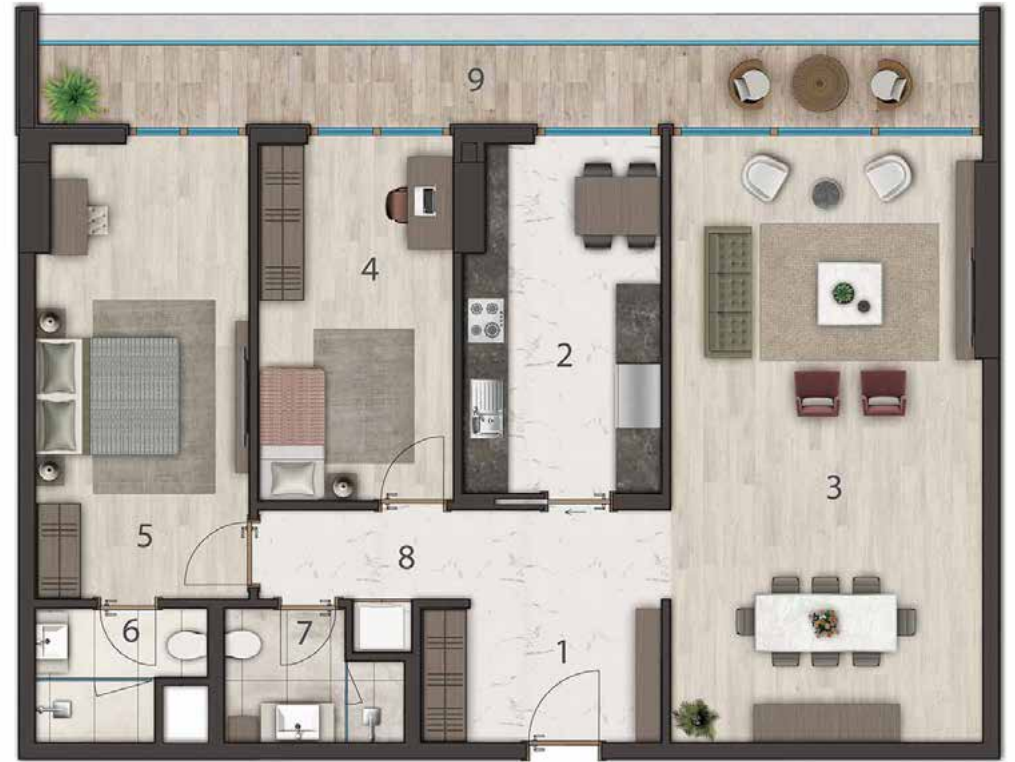
2+1 155 m2