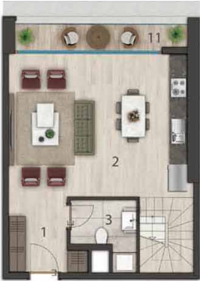
2+1 Duplex 175 m2