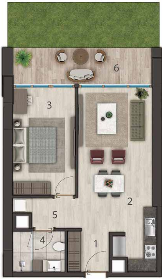
1+1 81 m2