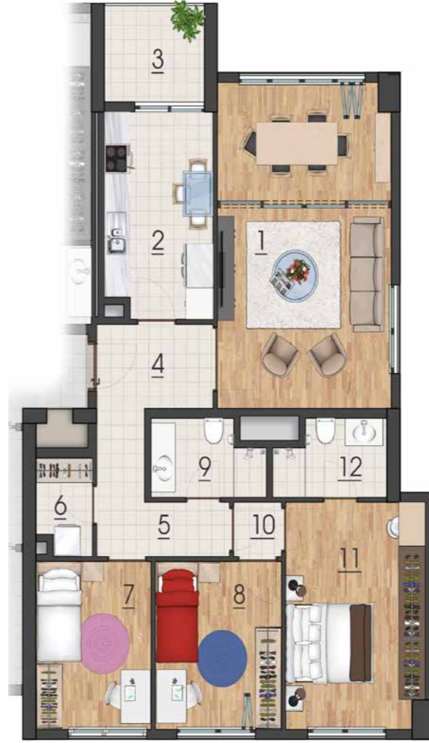
3+1 137 m2