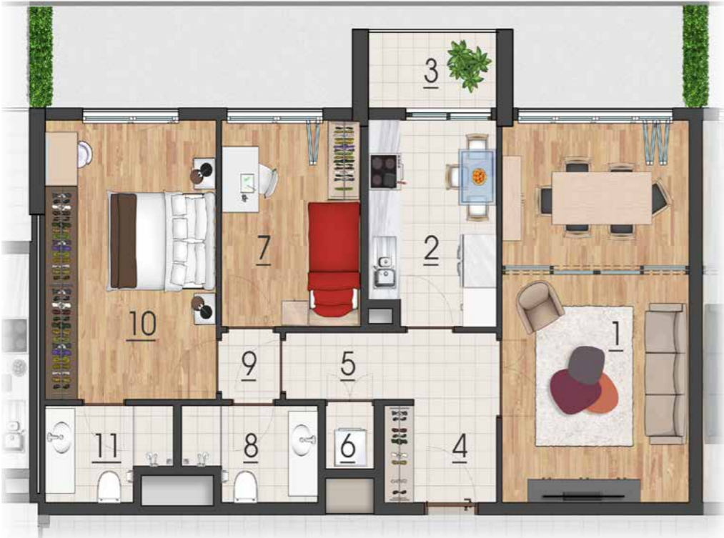
2+1 123 m2