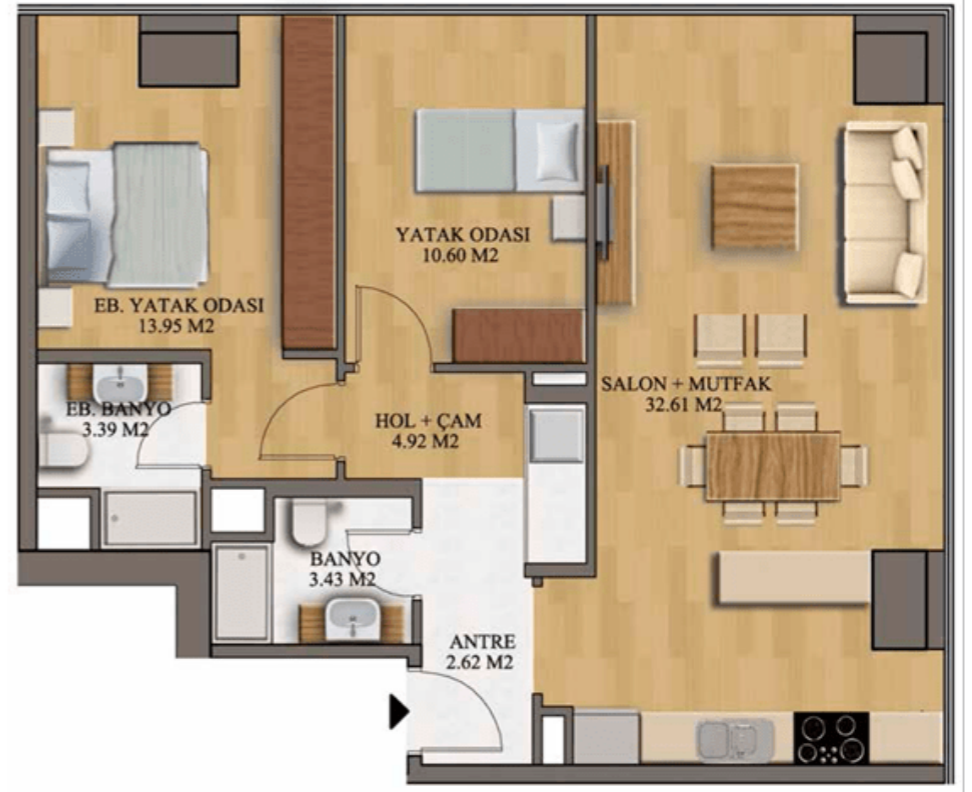
2+1 109 m 2