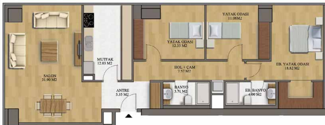
3+1 160 m 2