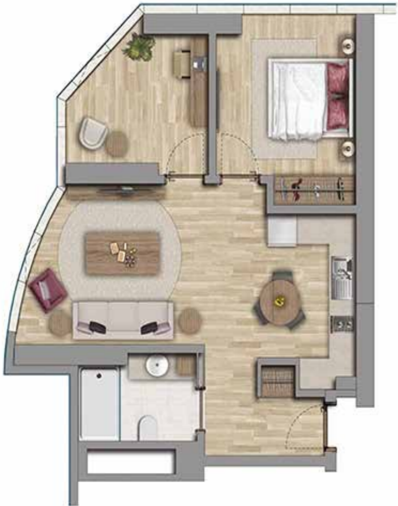
2+1 69 m2