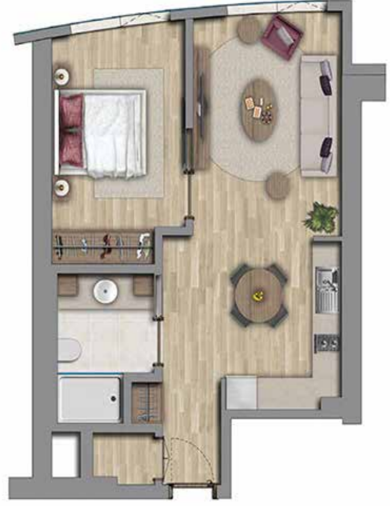
1+1 88 m2