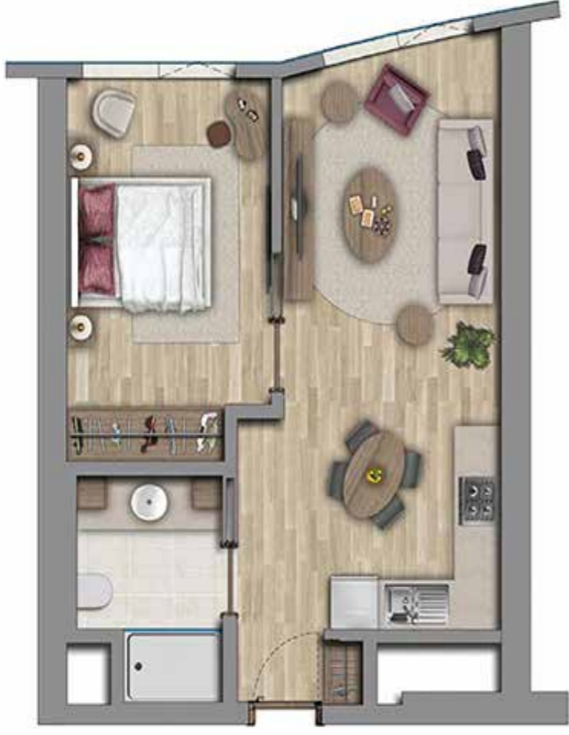
1+1 62 m2