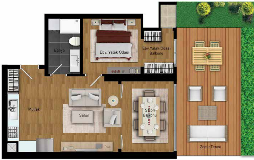
A BLOK 1+1 TİP 13A SATIŞ ALANI : 104,21 m 2