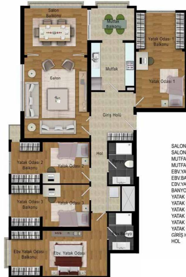
J BLOK 4+1 TİP 2 SATIŞ ALANI : 207,05 m 2