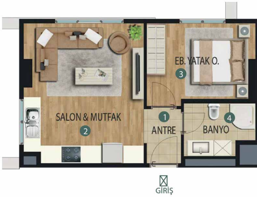
1+1 54 m 2