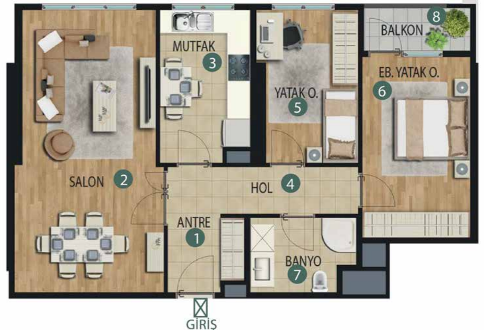
2+1 95 m 2