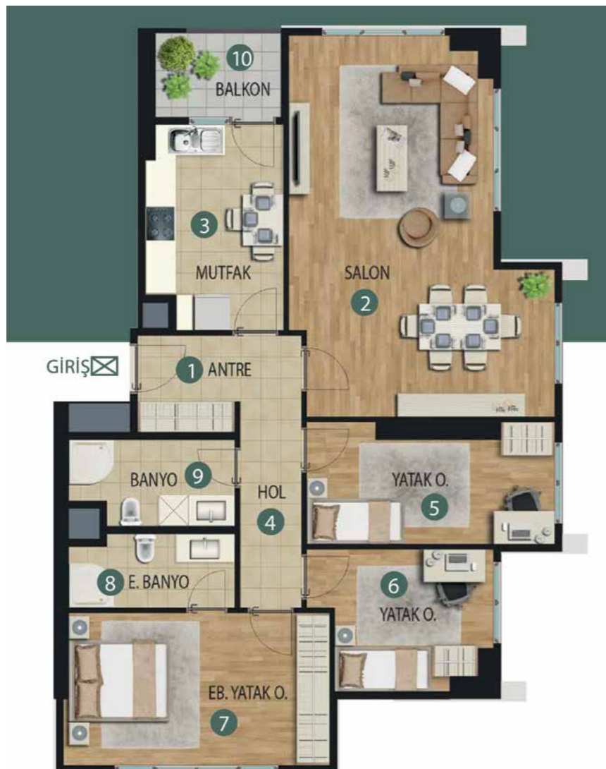
3+1 132 m 2